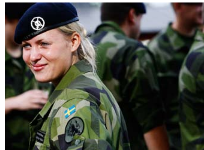
Soldat redo för utlandsuppdrag.

Verksamhet för elever och lärare våren 2010